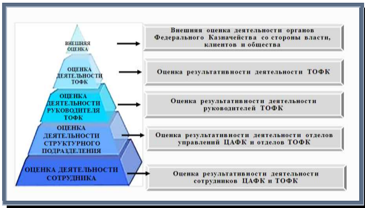
Рисунок 2. Система оценки эффективности деятельности Федерального казначейства

Основная задача действующей системы оценки – вооружить руководителя соответствующего уровня реальными сведениями о деятельности объекта оценки, которые позволят выработать управленческие решения, направленные на повышение качества исполнения возложенных государственных функций.