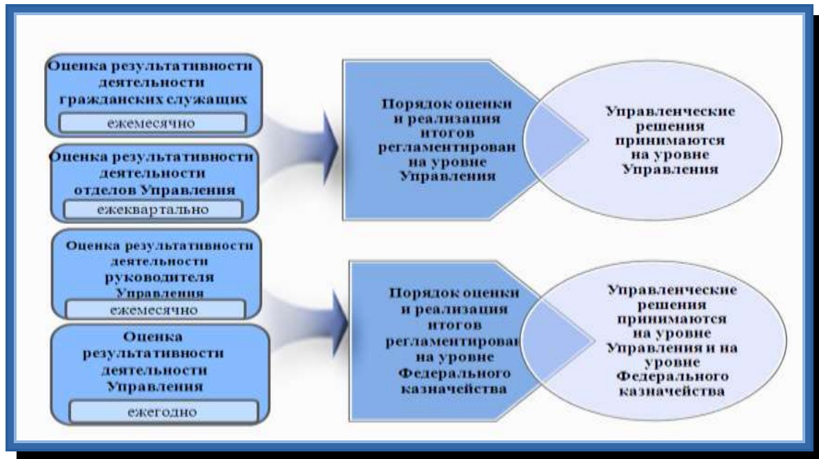
Рисунок 3. Объекты оценки в Управлении