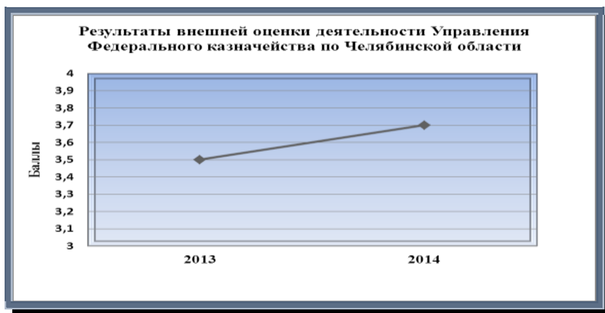
Рисунок 6. Динамика результатов внешней оценки деятельности Управления

При максимально возможной оценке в четыре балла общая средняя оценка деятельности Управления (территориальных отделов) за 2013 год составила 3,5 балла, а за 2014 год – 3,7 балла.